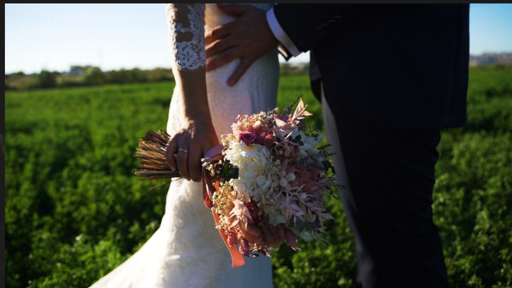
Película - Víctor & Sara