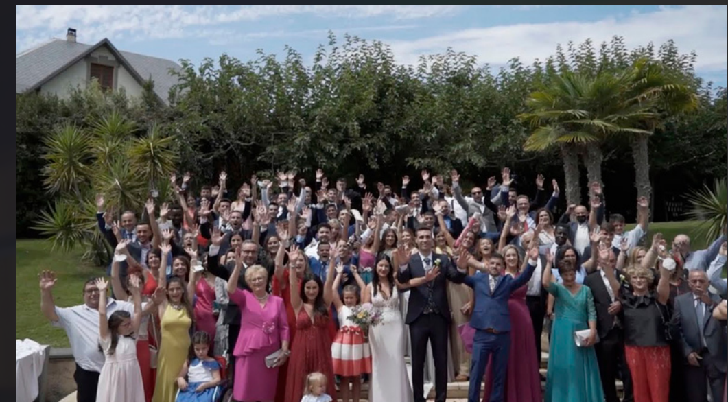
Película - Cristina & Cristian