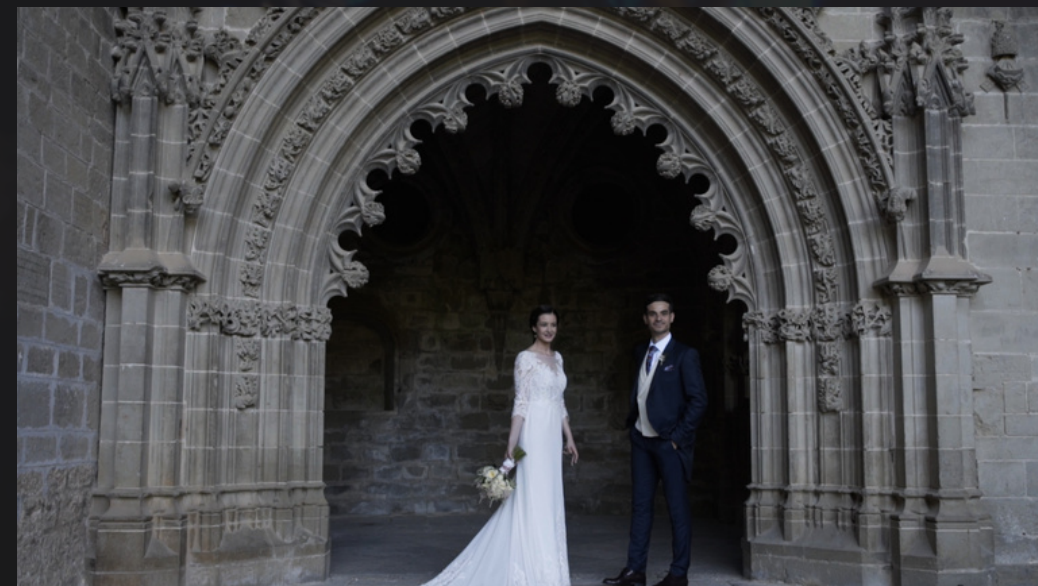
Película - Carlota & Alejandro