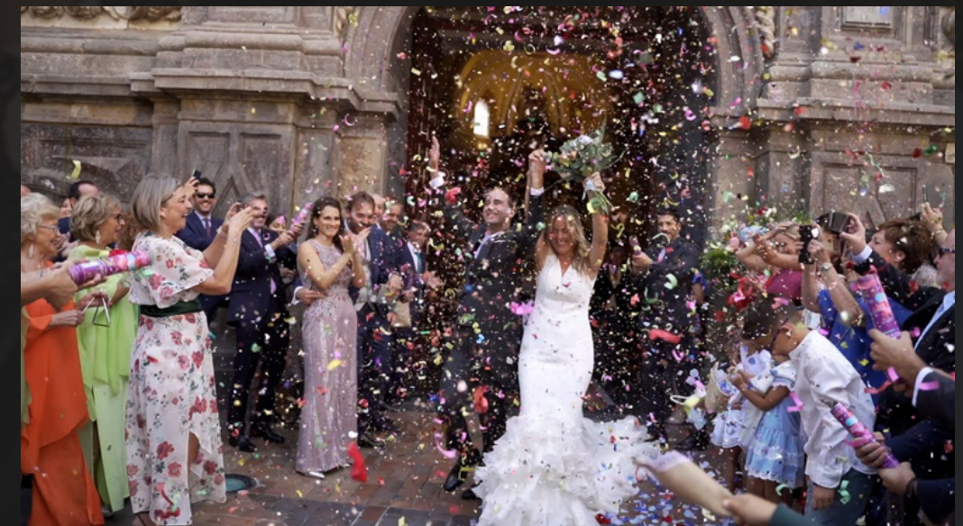
Película - Elisa & Ángel